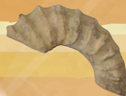
アンモナイトの化石