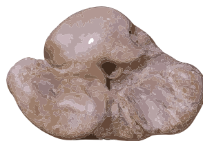
「ほてい石」は何の耳骨かな