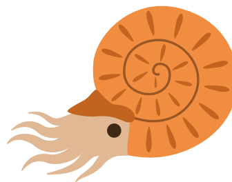
アンモナイトは時代によって種類が違うよ

⑤ 銚子でみつけるコハクは日本で最も(古い・新しい)。虫入りコハクも発見されています。