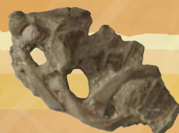
クジラの化石 (首と肋骨)